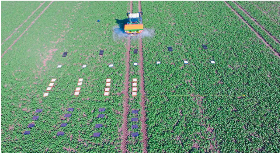
Die Prüfsets sind unterschiedlich in der Handhabung. Wichtiger ist, dass man regelmäßig aufstellt.