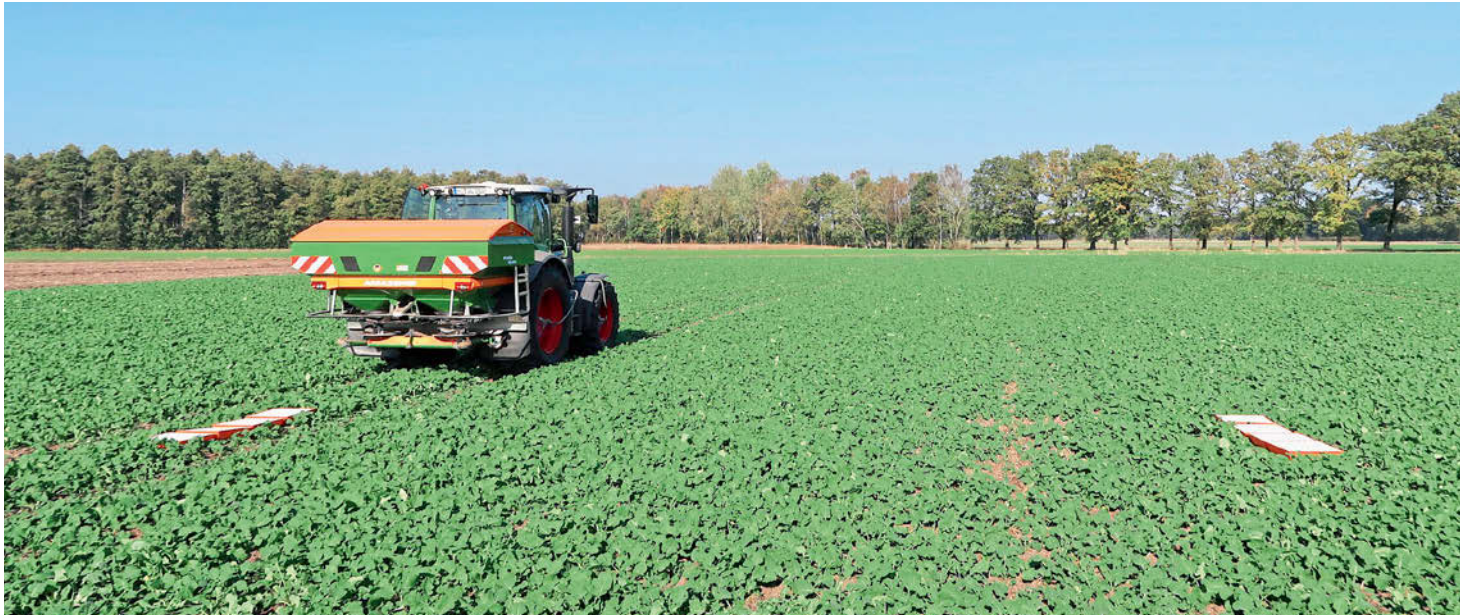
Nur mit einem Prüfset lässt sich die Querverteilung und damit die richtige Einstellung des Streuers überprüfen. Der Aufwand lohnt sich.

Streuer nicht sauber arbeitet: Fällt zu viel Dünger in die Überlappungszone, streut die Maschine zu breit. Fällt zu wenig dort hin, streut sie zu schmal. Zur Anpassung der Arbeitsbreite sind jetzt nur noch wenige Handgriffe notwendig.